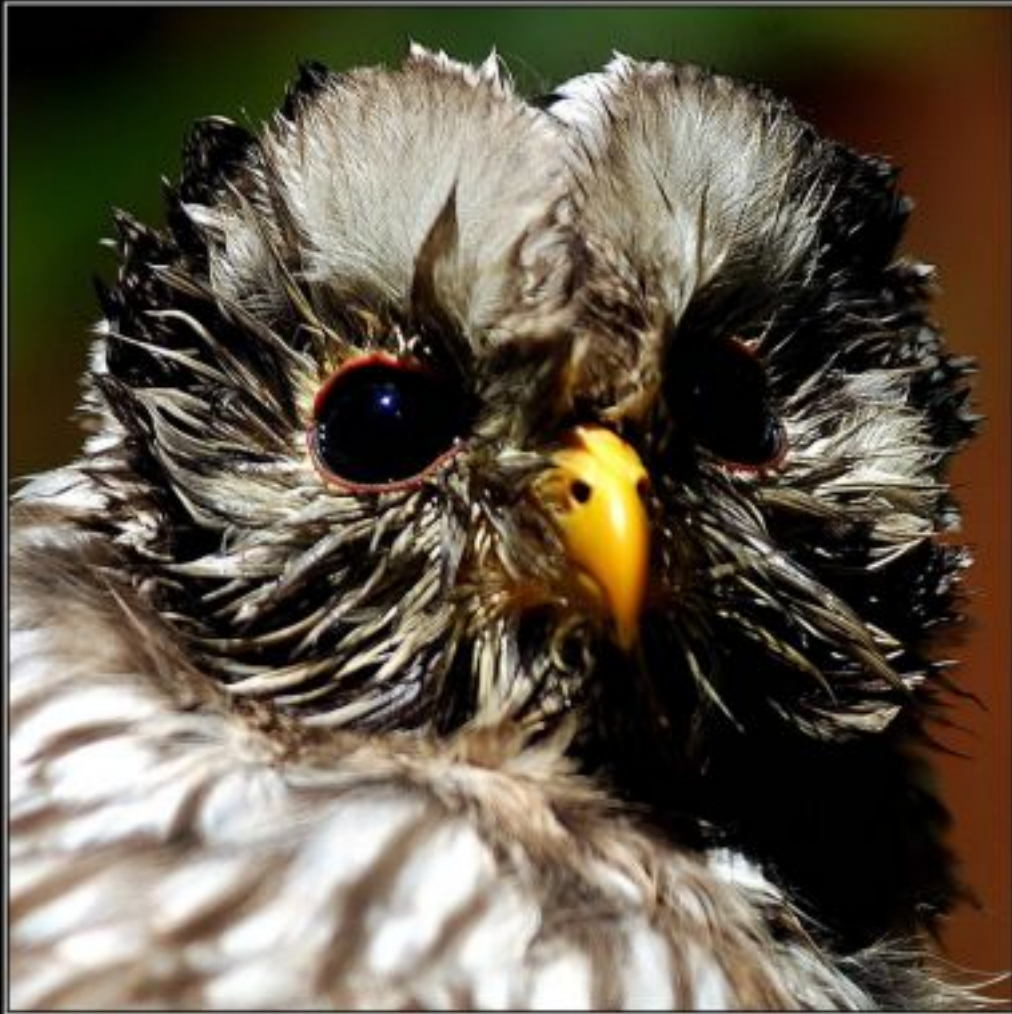
Kategorija: Ptice i životinje - I. nagrada. Aleksandar Bonacic iz Zadra za fotografiju