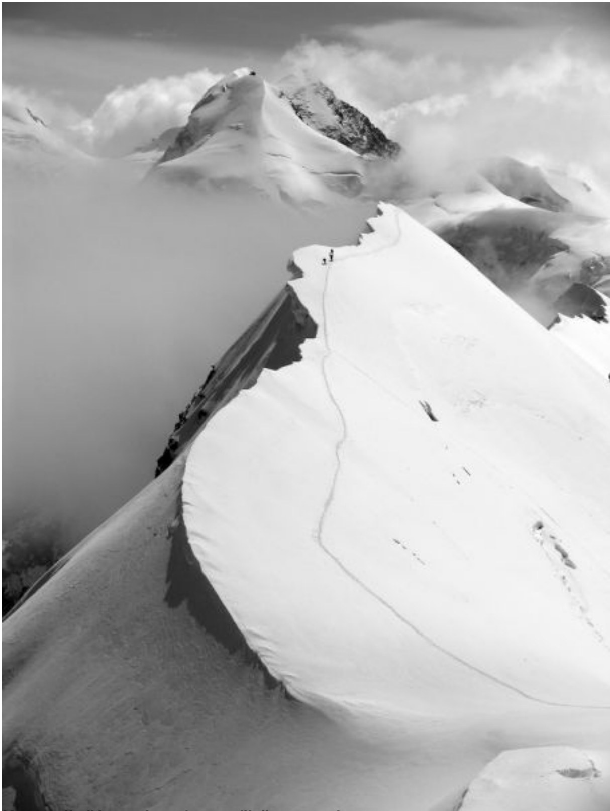
Kategorija "Apstraktna fotografija" i nagrada Jerolim Reberžak za fotografiju