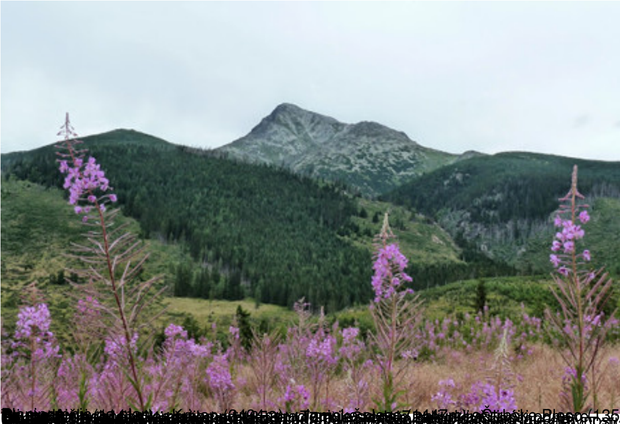
Planina Štrbská (1355m) a Zelená dolina (1250m) v Tatrách, Slovensko.