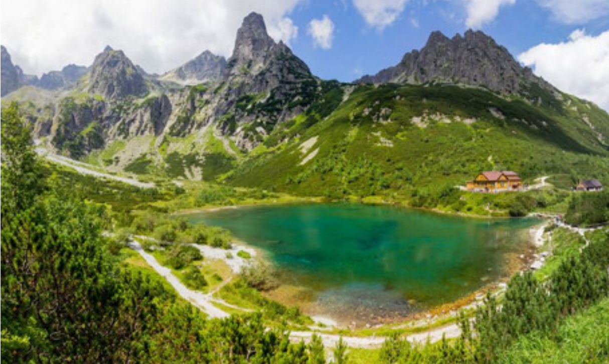
Zelená dolina (1250m) v Tatrách, Slovensko.