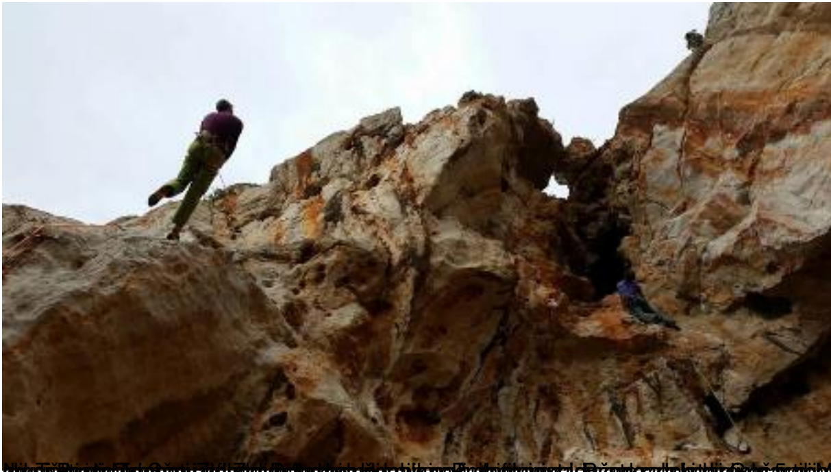
Učesnici na organizaciji, zasluzni i bez njih ne bi bilo ništa. Džabrovaletta, 6a-5. st. Mandžon