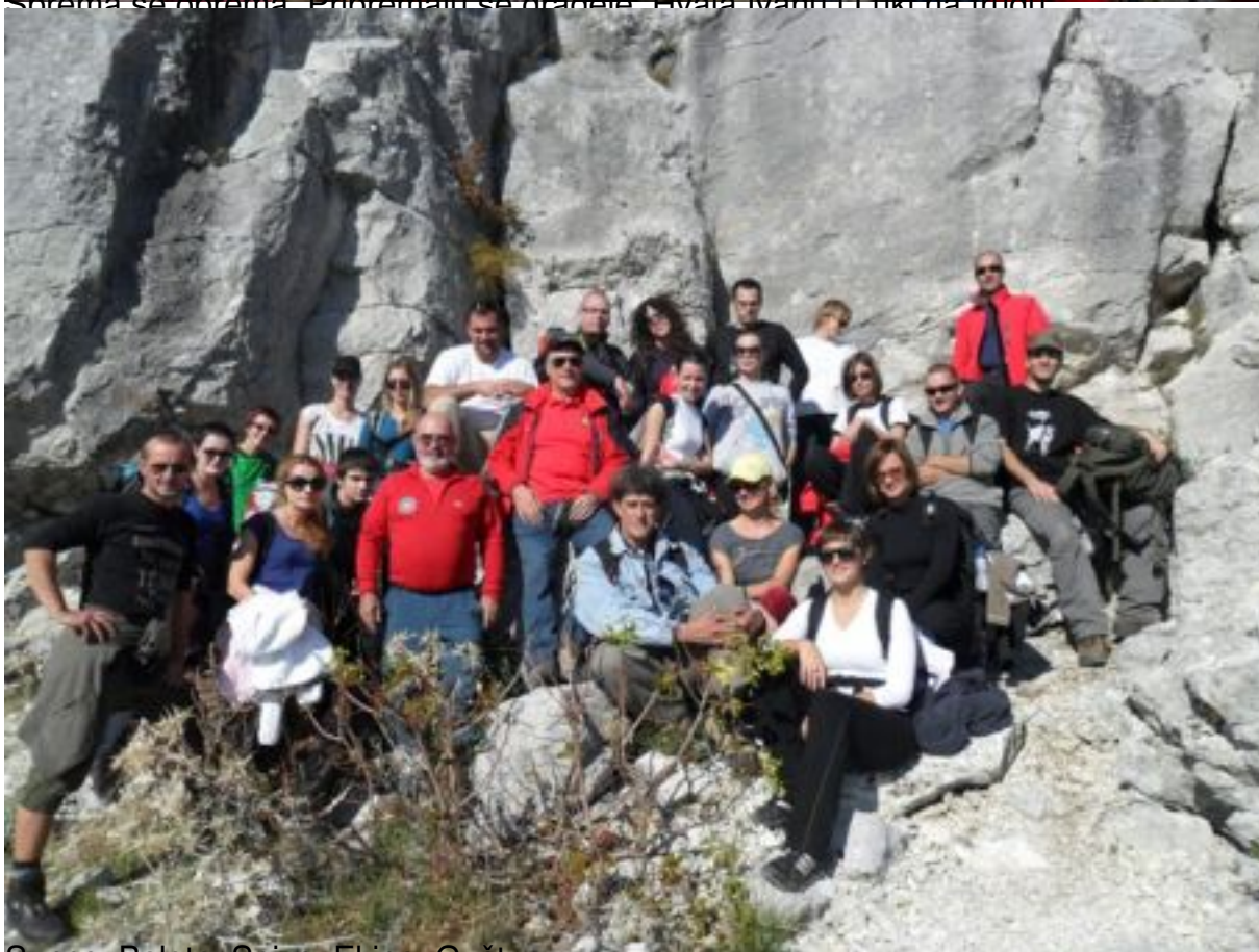
Sunce. Balote. Spiza. Ekipa. Gušt.