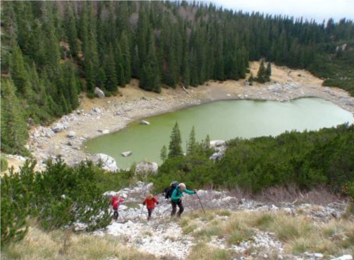
Durmitorski nacionalni park (21.07.2012) - Mrežnica - Kraljevićev izvor - Vukobrat - Durmitorsko jezero