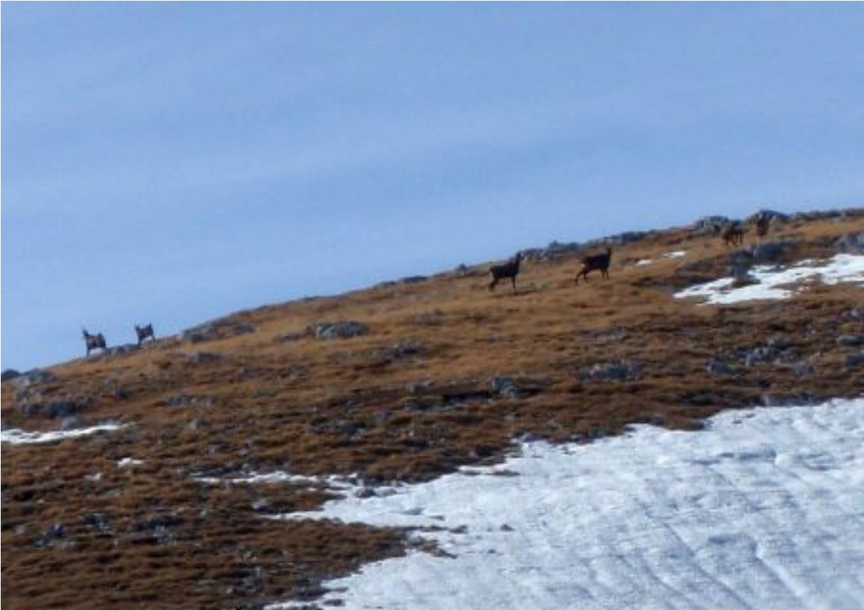
Stariš na Durmitoru, 09. studeni 2012. 15 min. od hrvatske granice. Stariš je sjajno mjesto za odmor.