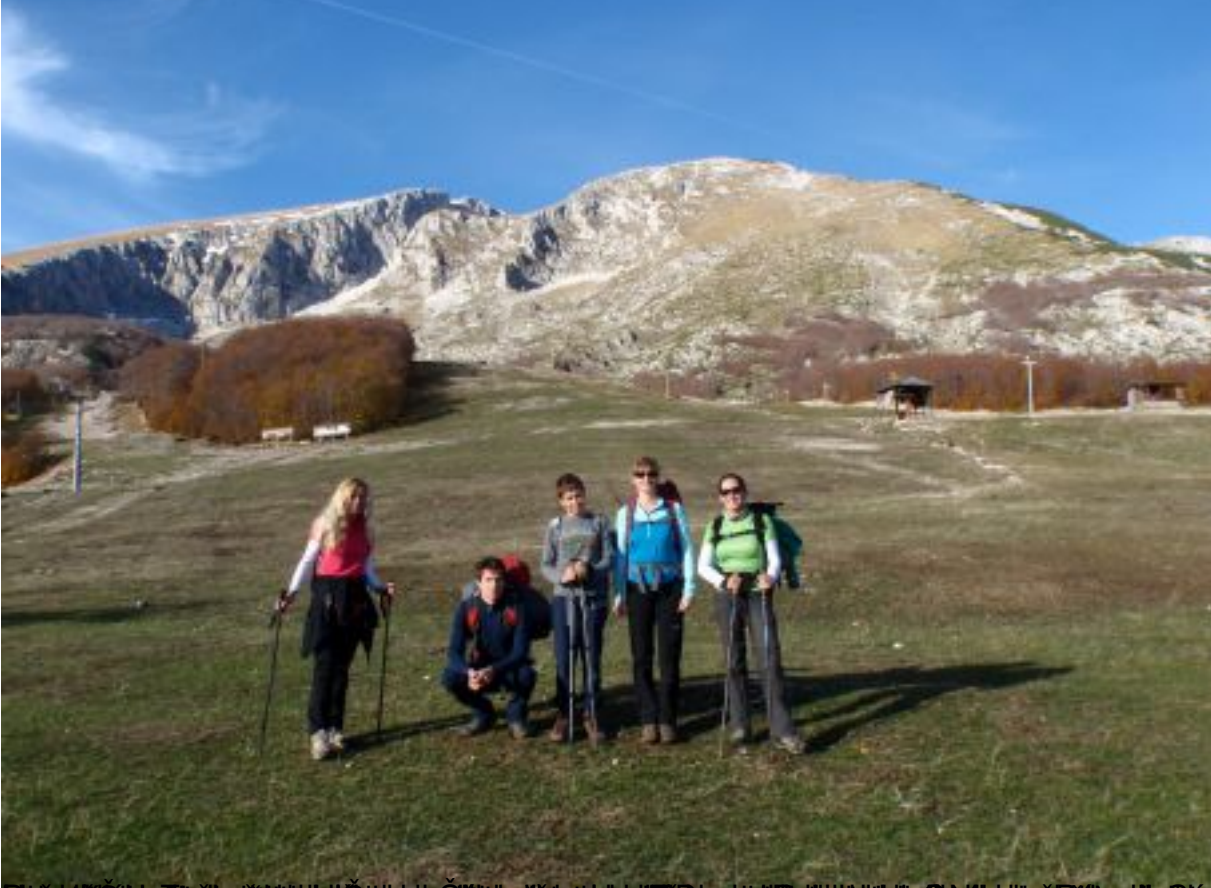
Grupa hokejaša i članovi Društva Štašići na izlasku iz Školec, na granici između Republike Srbije i Crne Gore