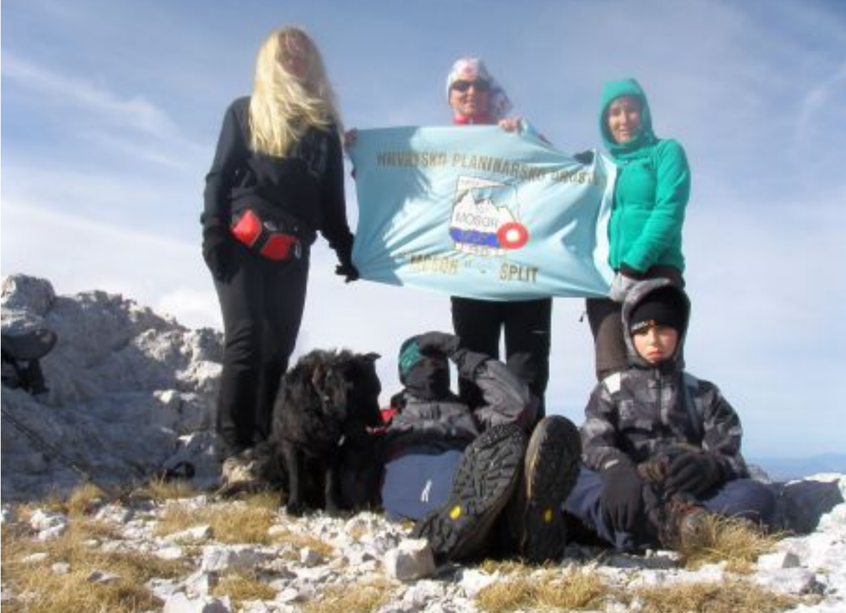
Grupa na Durmitoru, 09. studeni 2012. 15 min. od hrvatske granice. Stariš je sjajno mjesto za odmor.