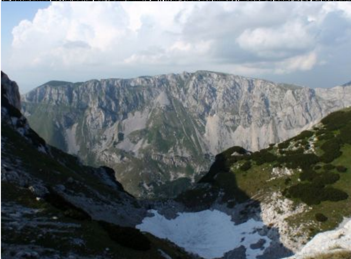
Štita, Dječiji jezero, Durmitor, Crnojevićki narodni park, Crna Gora