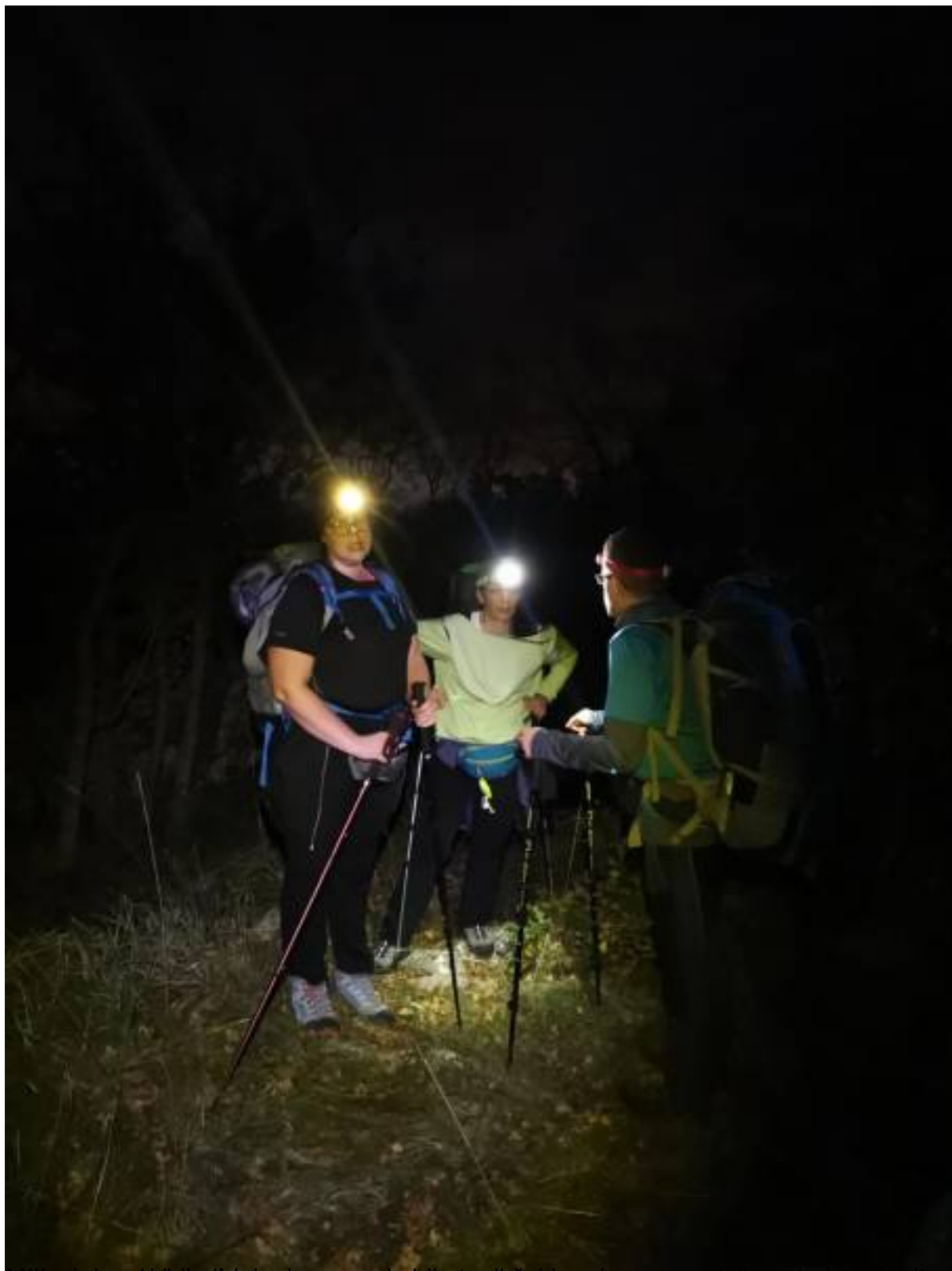
preko snijaga i zaoblata je nagrada bila topli čaj i prekrasan zadnji pogled na Jupiter i Veneru