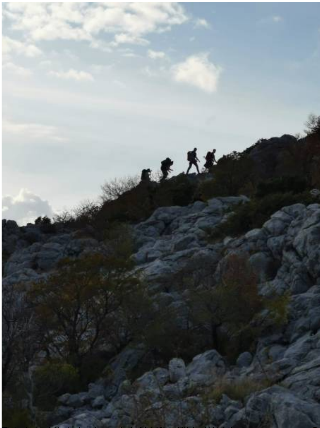
Prezasi bosna sjevernja silova, gradarveci i sku. tvdavae pjeszaka. nio se prve sezone Game of