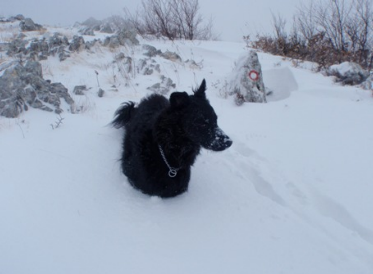
Stožerica, 21. veljača 2012. Sadržaj: Dabogda se ponovilo i dogodine