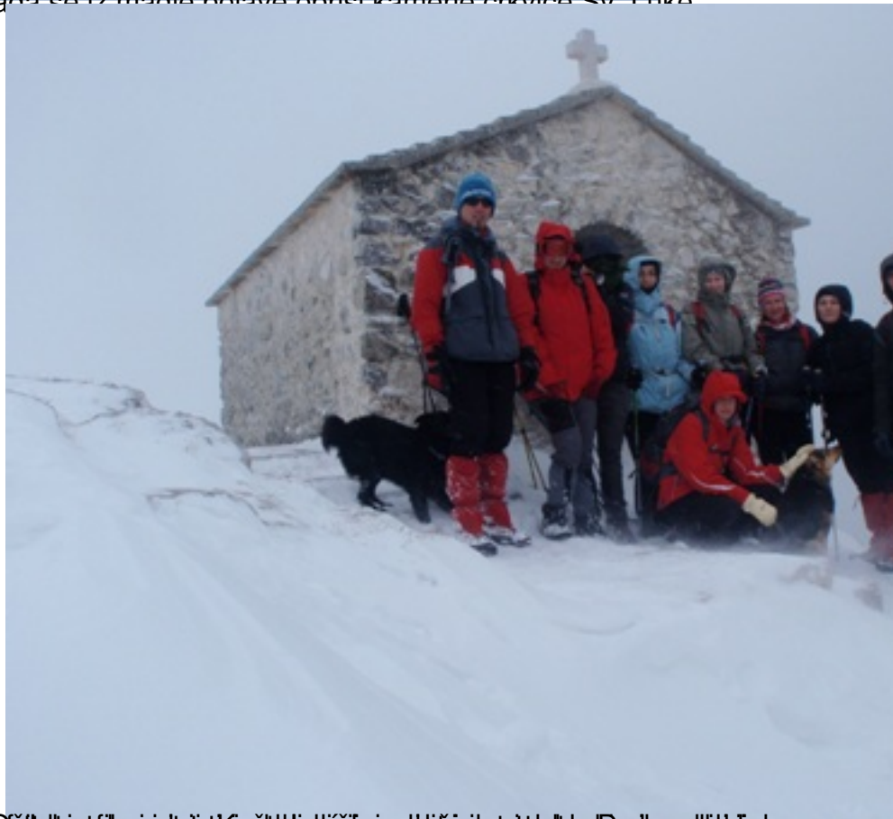
Stožerica, 21. veljača 2012. Sadržaj: Dabogda se ponovilo i dogodine